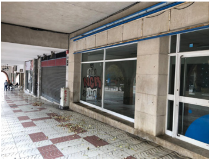
El local de campanya de TxSFG situat a la plaça Salvador Espriu