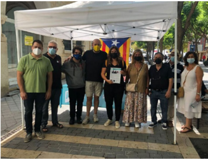
Carpa situada al carrer Major de Sant Feliu de Guíxols

El mes de juliol passat l'equip de Junts per Sant Feliu de Guíxols vam iniciar la campanya “Escoltem als Barris”, amb la que volem que els nostres veïns i veïnes ens expliquin quines són les coses que es poden treballar i canviar al seu barri per millorar-lo.