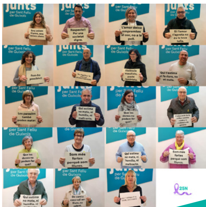
Muntatge de fotografies dels participants

El passat dijous 25 de novembre es va celebrar el dia internacional per a l'eliminació de la violència envers les dones.