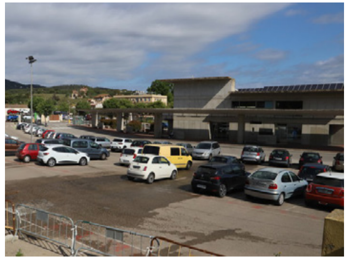
Vista del pàrquing públic situat darrere l'estació d'autobusos