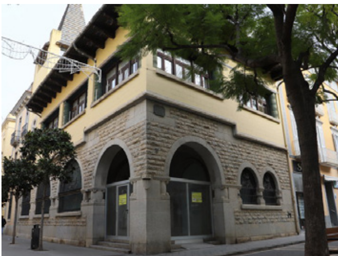
Local de l'antiga oficina de "La Caixa" a La Rambla