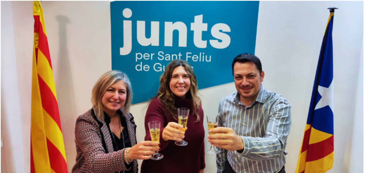
Els regidors de Junts per Sant Feliu de Guixols us desitgem bones festes i pròsper 2022